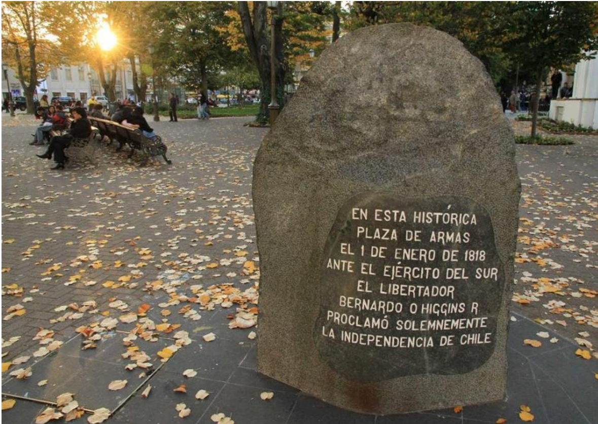
Monolito que recuerda el lugar en que se proclamó la independencia de Chile

Considerando la importancia de este hecho histórico, la I.Municipalidad de Concepción, en colaboración con el Programa de Patrimonio Cultural de la Universidad de Concepción, realizan el presente llamado correspondiente a un concurso de ideas para estudiantes de arquitectura o arquitectos recién titulados de las facultades de arquitectura de Concepción. Este concurso se enmarca en el programa "CONCEPCIÓN CIUDAD DE LA INDEPENDENCIA", que culminará con la celebración de los 200 años de independencia de Chile a celebrarse el próximo año.